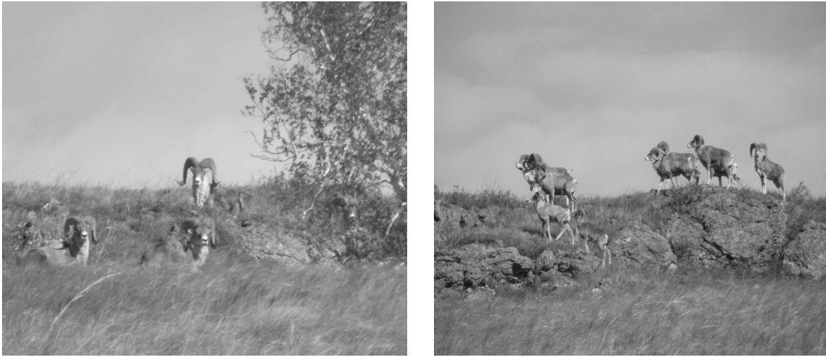
4-сурет. Қазақстан арқары ( Ovis ammon collium )

Сарыарқа, Қаратау, Қызылқұм шөлі) мекендейді. Қарағанды облысында осы түрлердің ішінде қазақстан арқары кеңірек таралған. Біз қарастырып отырған «Бұйратау» Мемлекеттік табиғи бағында осы арқардың түрі кездеседі (4-сур.).