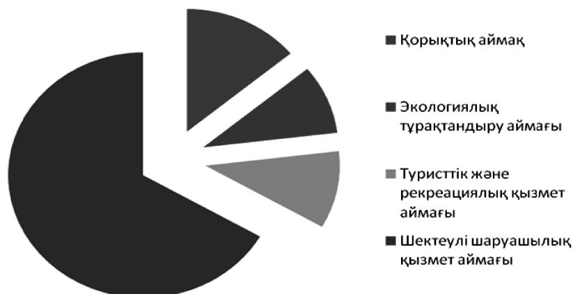
1-сурет. Бұйратау паркінің қорғау режимдік көрсеткіштері

Осылайша, қорықтық қорғау режимімен парктің 23,1 % аумағы қамтылған. Болашақта қорықтық аймақтарды көбейту мақсаты тұр. Қорғалатын аймақтарда табиғи жағдайда жануарлар санын реттеу, қадағалау қолайлы.