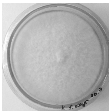
в — F. oxysporum контроль