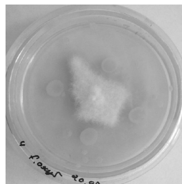
г — штамм AS29 против F. oxysporum